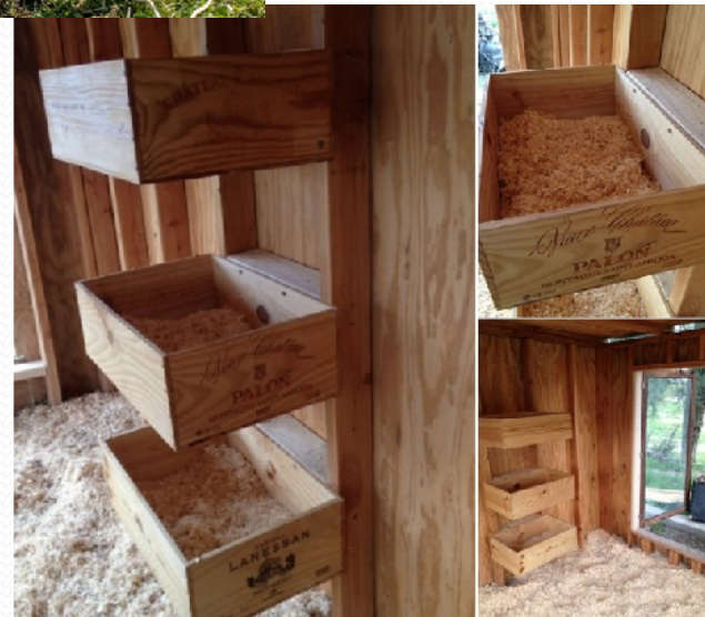
14 Multi-Choice Nest Box